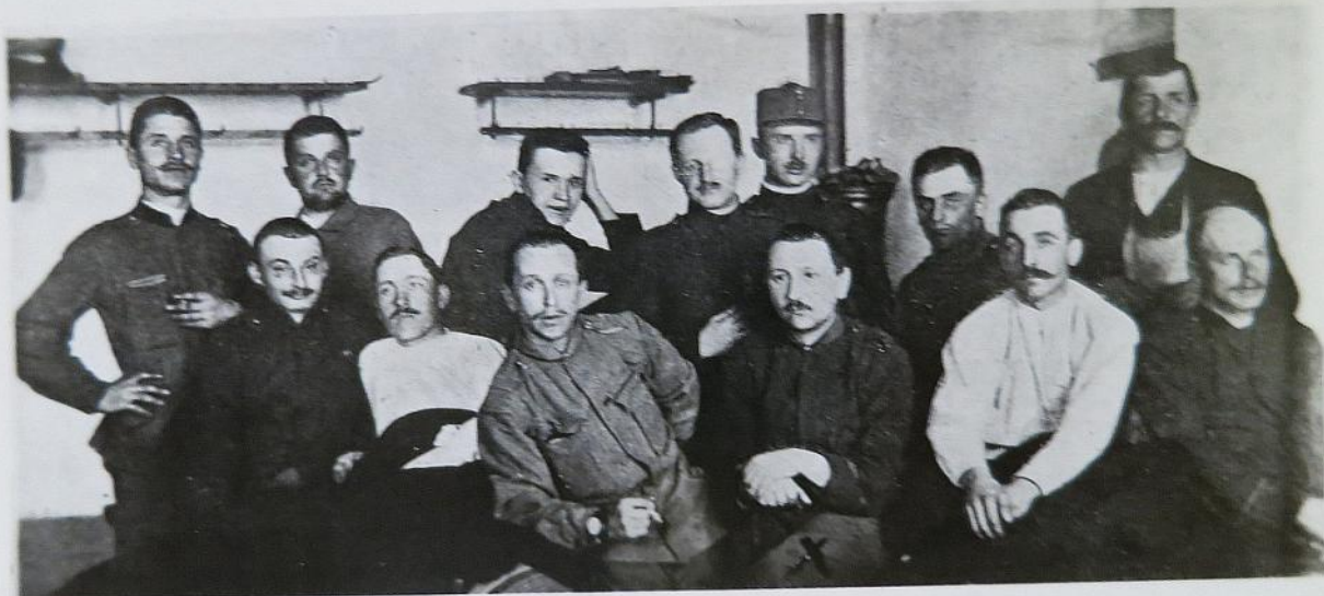
30.4.1915 Fotografie pořízená v posádkové nemocnici v Českých Budějovicích v kasárnách Landwehru v dnešní Žižkově ulici (dříve Radeckého). Fotografie byla uveřejněna v časopise Světozor. Jaroslav Hašek je zde označen křížkem. Více zde