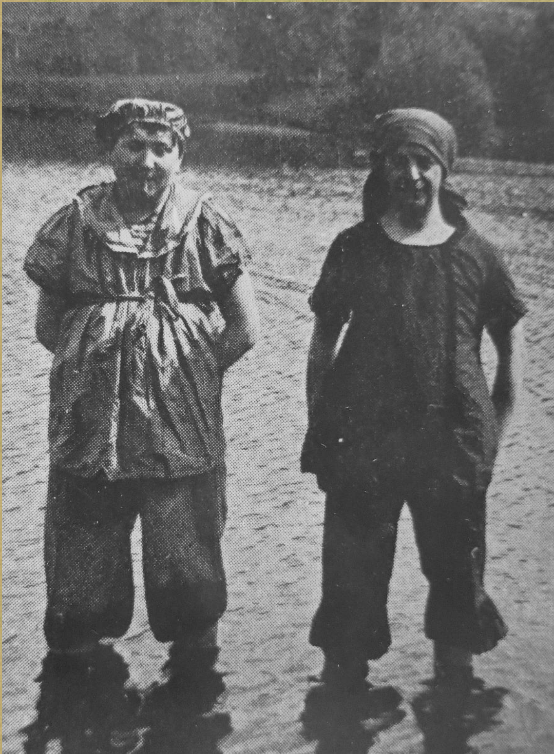
18. 5. 1912 Na dadaistickém výletě spolu s Matějem Kudějem v květnu 1912 do Nového Jáchymova: "Dvě ztracené existence v tomto úboru oživují poezii v neprobádaných dosud krajích Podbrdská. Příjemné styky s bezpečnostními orgány, každodenně." Průběh této Tulácké a bohémské pouti zachytil Kuděj podrobně v knize "Ve dvou se to lépe táhne" . Snímek byl otištěn v časopise Český svět.[33]