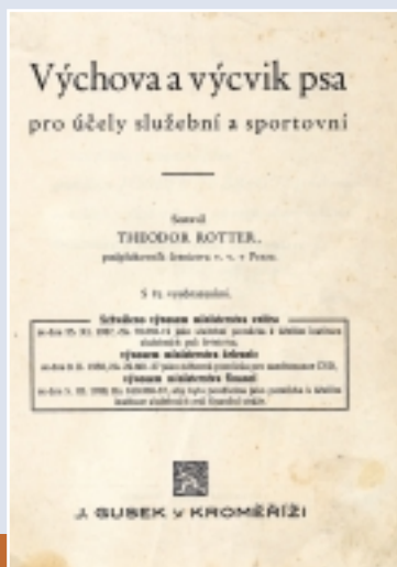
Titulní strana jedné z příruček zpracovaných Theodorem Rotterem