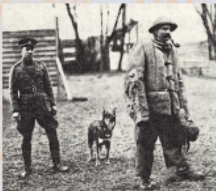
Tulák doprovázený služebním psem

V roce 1910 byli na popud rytmistra Rottera s povolením ministerstva zeměbrany zařazeni na četnických stanicích v Ostravě, Karvině a Fryštátě tři policejní psi v majetku svých vůdců, kteří byli k tomuto účelu řádně vycvičeni. Vzápětí nato se na četnické správě hromadily požadavky ostatních zemských četnických velitelství, aby i u nich byli na zkoušku povoleni policejní psi. V té době vydal rytmistr Rotter svoji první publikaci o výcviku policejního psa, která obsahovala první pokyny k výcviku psa s požadavky na vlastnosti a schopnosti, které musí vycvičený pes mít před zařazením do služby. Policejní pes byl v bezpečnostní službě používán předně jako pes hlídací (strážní), za druhé jako pes doprovázející četníka (přesně v duchu doporučení dr. Hanse Grosse), a za třetí ve službě pátrací, a to buď bez použití na osobu, nebo s použitím na osobu. Tím bylo myšleno použití vycvičeného psa kromě stopovacích prací k překonání odporu zlo-