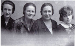
Matka s dcerami