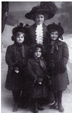
Na vycházce s dcerami

Psala nápaditě, svižně a konkrétně. Vžívala se do role psycholožky